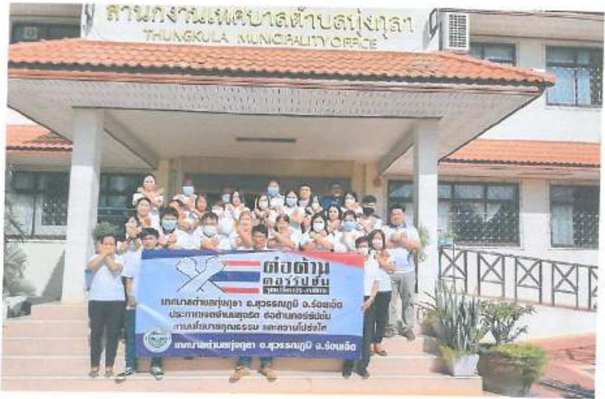
ภาพกิจกรรมการร่วมจัดงานวันต่อต้านคอร์รัปชันสากล(ประเทศไทย) วันที่ ๙ ธันวาคม ๒๕๖๕ ของเทศบาลตำบลทุ่งกุลารักษ์ อำเภอสุวรรณภูมิ จังหวัดร้อยเอ็ด